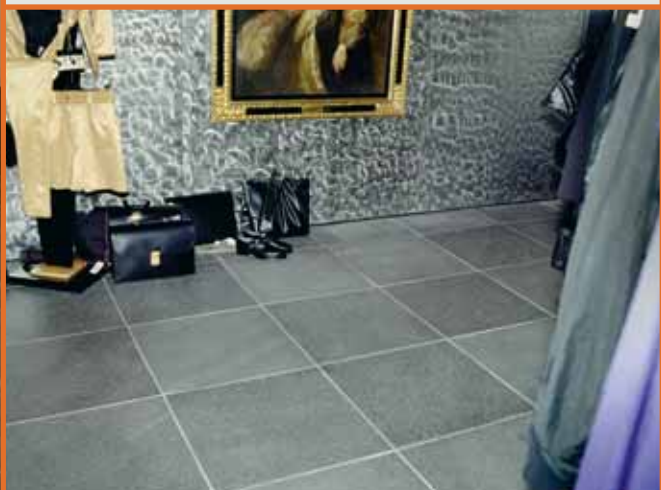
Flis i Altaskifer med natur overflate.