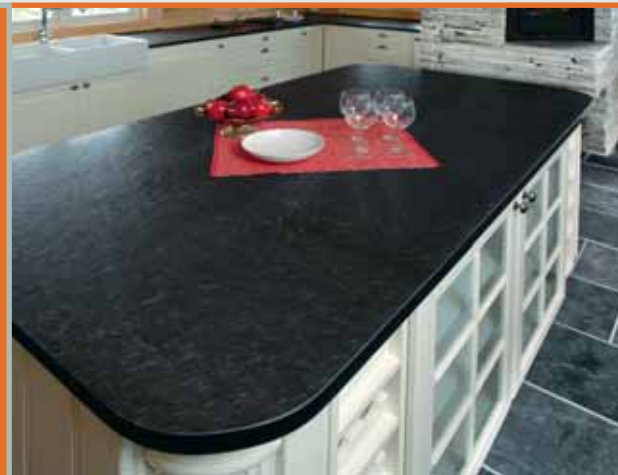
Benkplate i Ottaskifer (Pillarguri) med slipt overflate.

Skiferen tåler alle påkjenninger i vår daglige bruk - livet ut. Overflaten er vakker og vedlikeholdsfri.