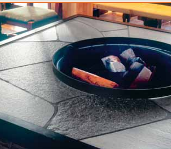
Bruddheller i Oppdalskifer med natur overflate.