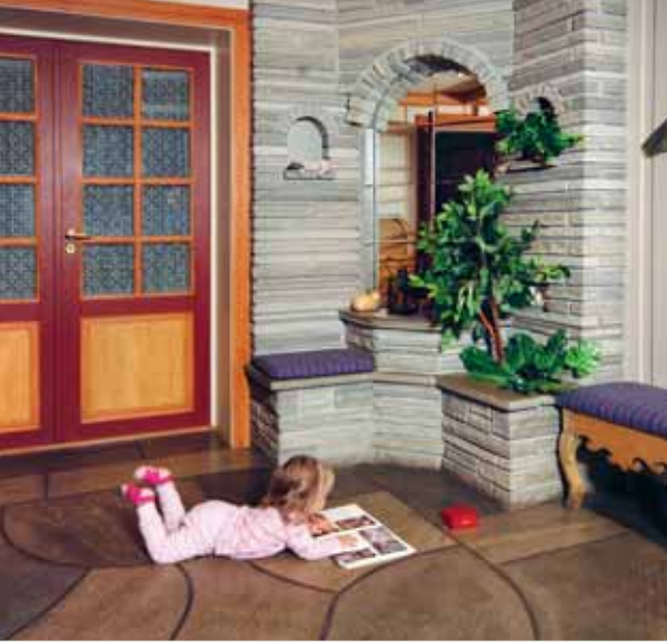
Mursten og bruddheller (gulv) i Oppdalskifer.