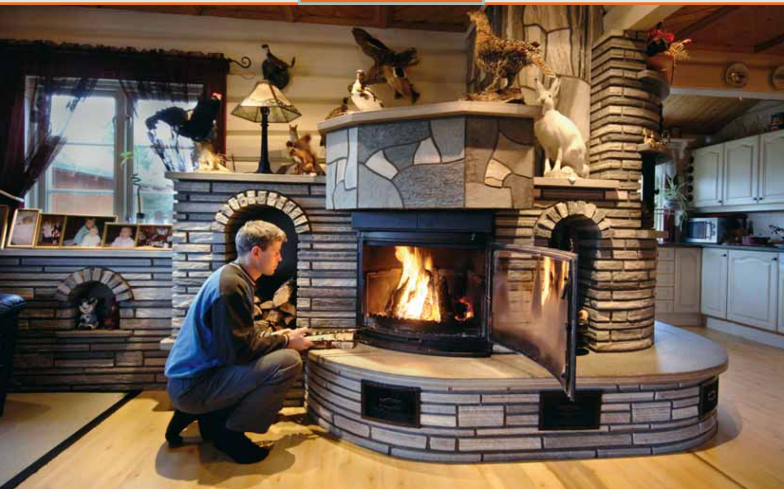
Mursten/stav og bruddheller i Oppdalskifer.