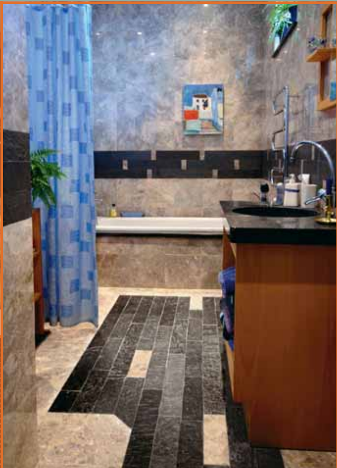
Flis i Ottaskifer (natur) i gulv og veggdekor og slipt benkplate.