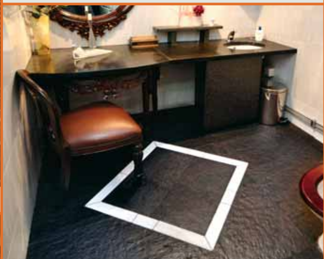
Flis i Ottaskifer, børstet i gulv og slipt benkflate.