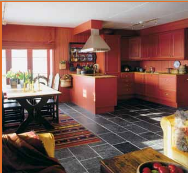
Flis i Ottaskifer med børstet overflate.