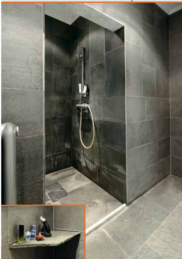
Flis i Offerdalskifer med slipt overflate, Innfelt: Hylle i Offerdalskifer.