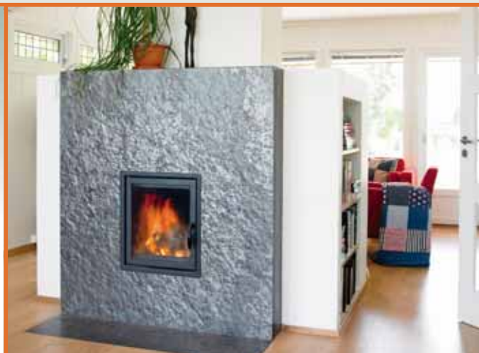
Peis med Ottaskifer - natur overflate.

Skifer skaper helhet og harmoni sammen med andre materialer. Interiøret er ikke bare til beskuelse, det skal tåle vår daglige bruk.