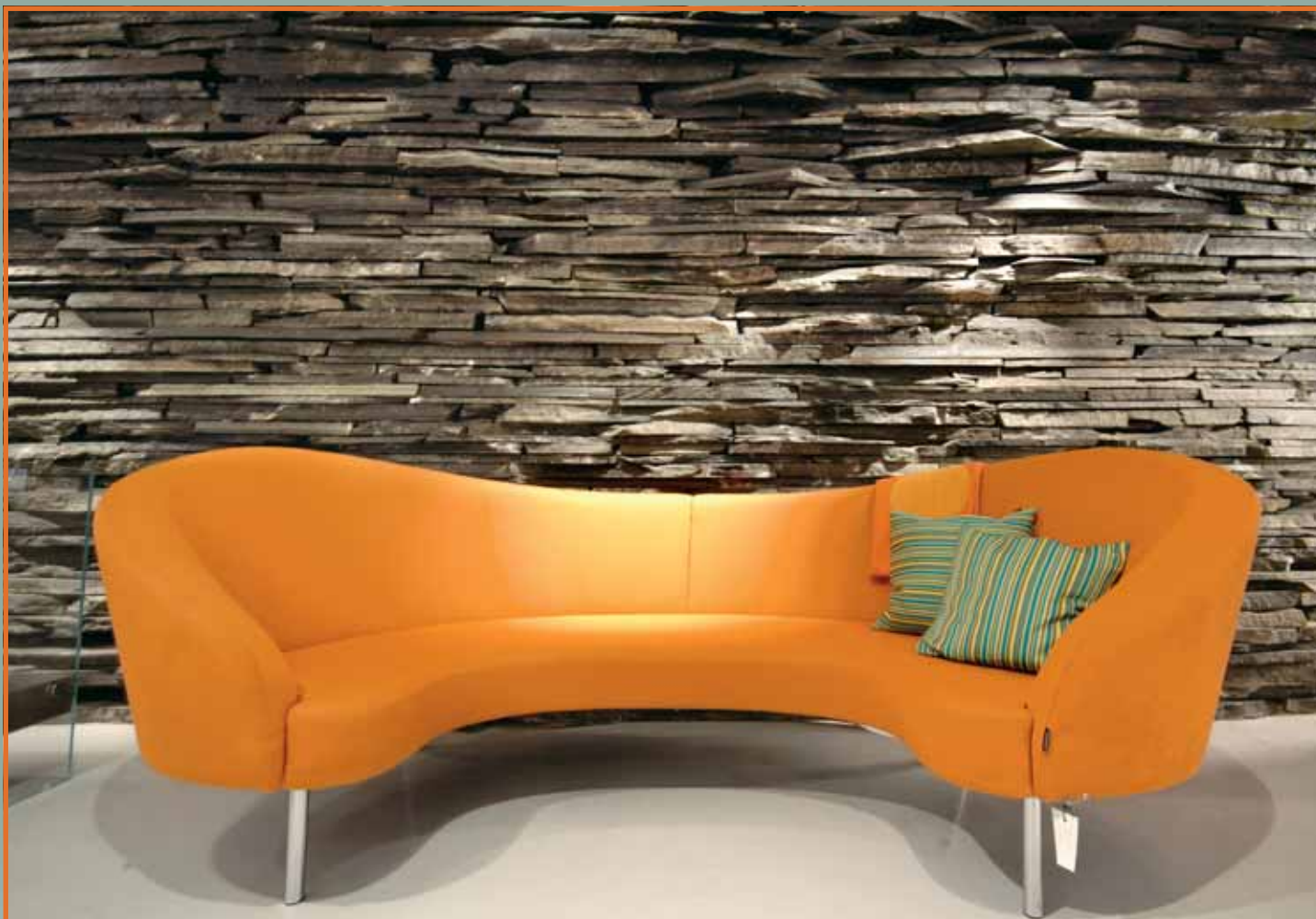
Tørrmur (10-30 cm) i Altaskifer til forblending.