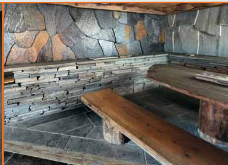
Bruddheller i Ottaskifer (Pillarguri og rust) og tørrmur i Oppdalskifer.