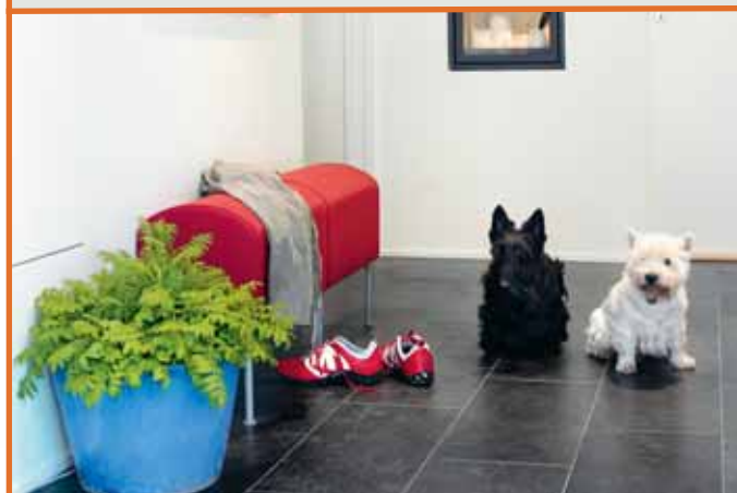
Flis i Ottaskifer med børstet overflate.