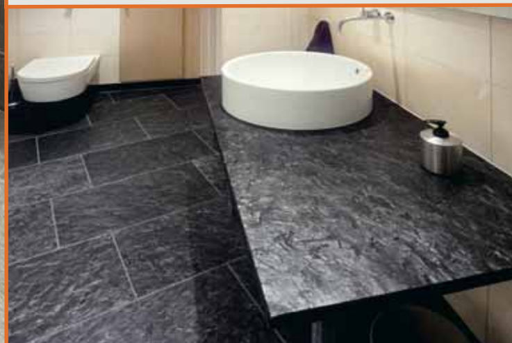
Flis og benkplate i Ottaskifer med børstet overflate,