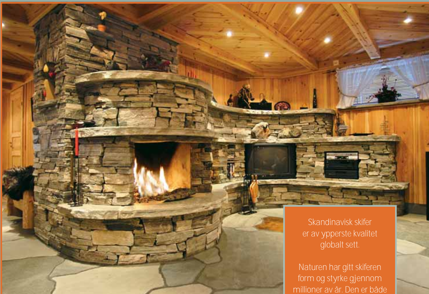
Tørrmur, peisheller (råhugget) og bruddheller i Oppdalskifer med innslag av Ottaskifer (rust).

Skandinavisk skifer er av ypperste kvalitet globalt sett.