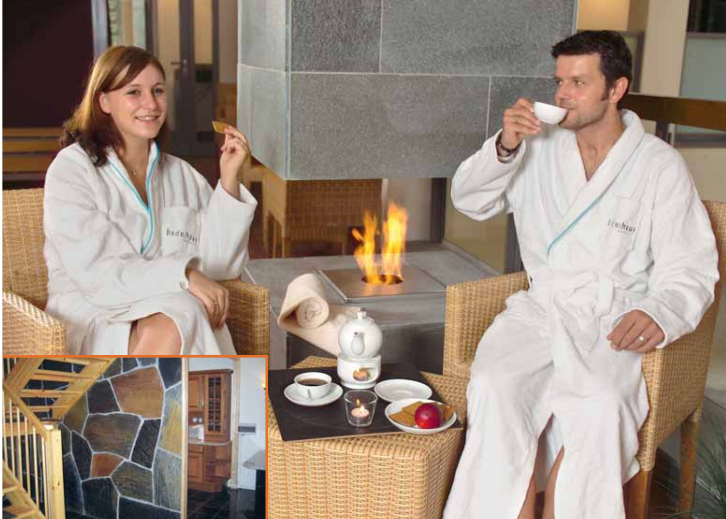
Bruddheller til forblending i Ottaskifer (Pillarguri og rust).