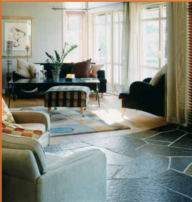
Bruddheller i Ottaskifer (Pillarguri og rust)