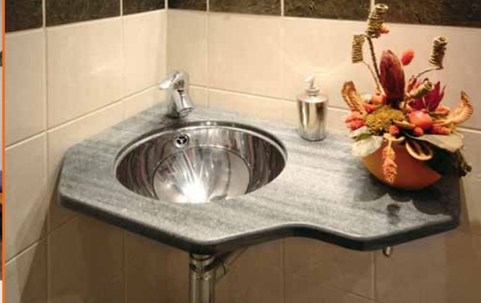
Benkplate i Oppdalskifer (mørk) med slipt overflate.

Skandinavisk skifer er slett ikke ensfarget grå og trist. Fargespillet i skifer er unikt og spesielt. Materialet har alle positive miljøfaktorer og er blitt en eksportvare i betydelig målestokk.