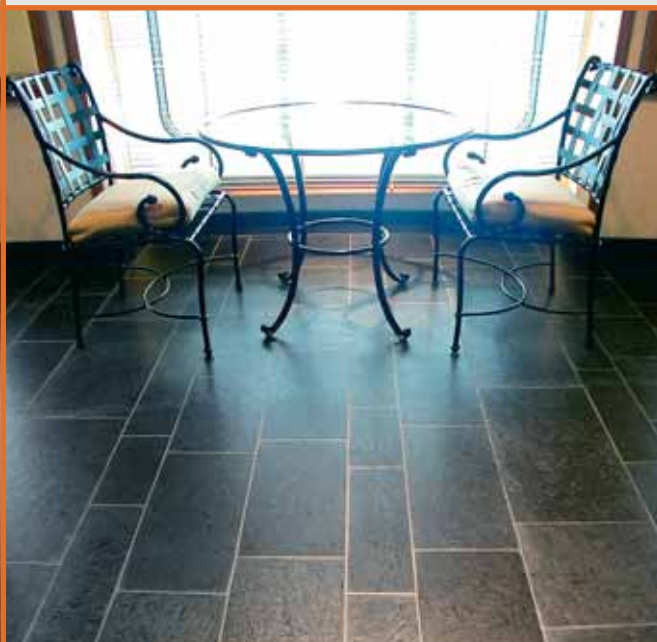
Flis i Ottaskifer (Pillarguri) med slipt overflate.